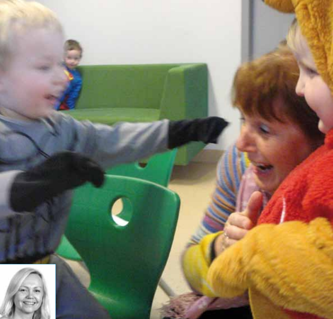
Prosjektleder: Førsteamanuensis ph.d. Elin Eriksen Ødegaard