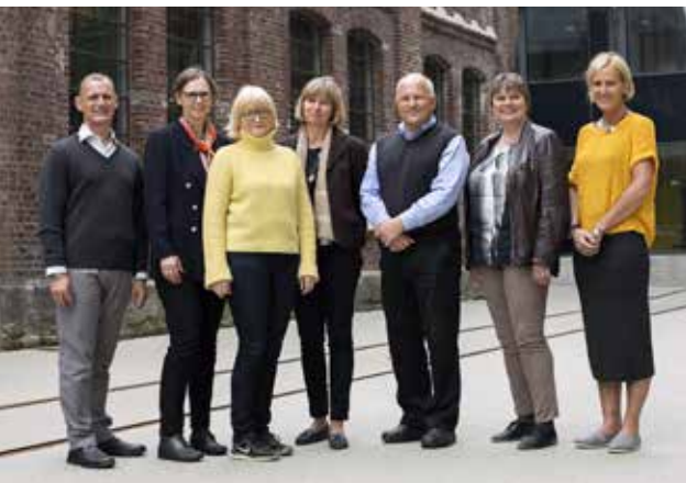
Ledergruppen i DiaHealth, fra venstre: